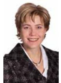
Henna Virkkunen Minister of Education and Science

It is a good indication of the strong commitment of the Finnish and US governments to cooperation between our countries that both have decided to increase the public funding of the Fulbright Program by 50 per cent. In a time of economic constraints, this is a significant policy decision and endorsement of the exemplary work done through the Fulbright network of partnerships. The long-standing commitment of the public authorities seems to work as an incentive in the way desired. In Finland technology companies and universities have established their own dedicated Fulbright scholarships. There is new drive and dynamism in our transatlantic cooperation.