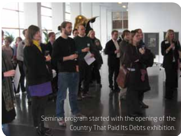
Seminar program started with the opening of the Country That Paid Its Debts exhibition.