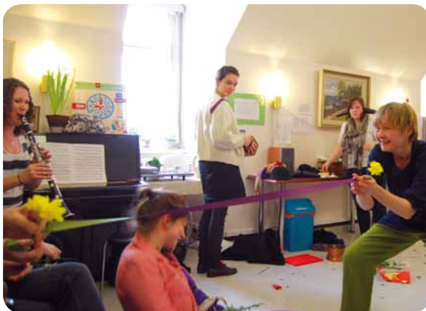
Fulbright Grantees doing community service. The group, “We Share” performed at the Deaconess Institute combining music, dance, performance art and improvisation.

We Fulbrighters maintain that the creation of an engaged and globalized citizenship is one of the greatest results of the Fulbright program, as mutual understanding through academic and cultural exchange is realized through the experiences of each grantee. To drive home the point, the Fulbright US student grant study proposal mandates: “Your project statement should contain a clear commitment to and description of how you will